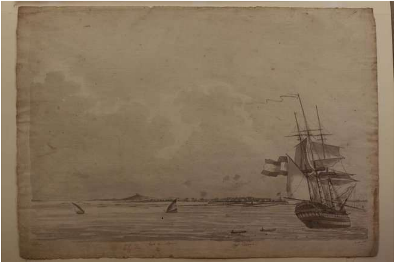
Oost Java – Fregatschip Evertsen voor de kust 1818