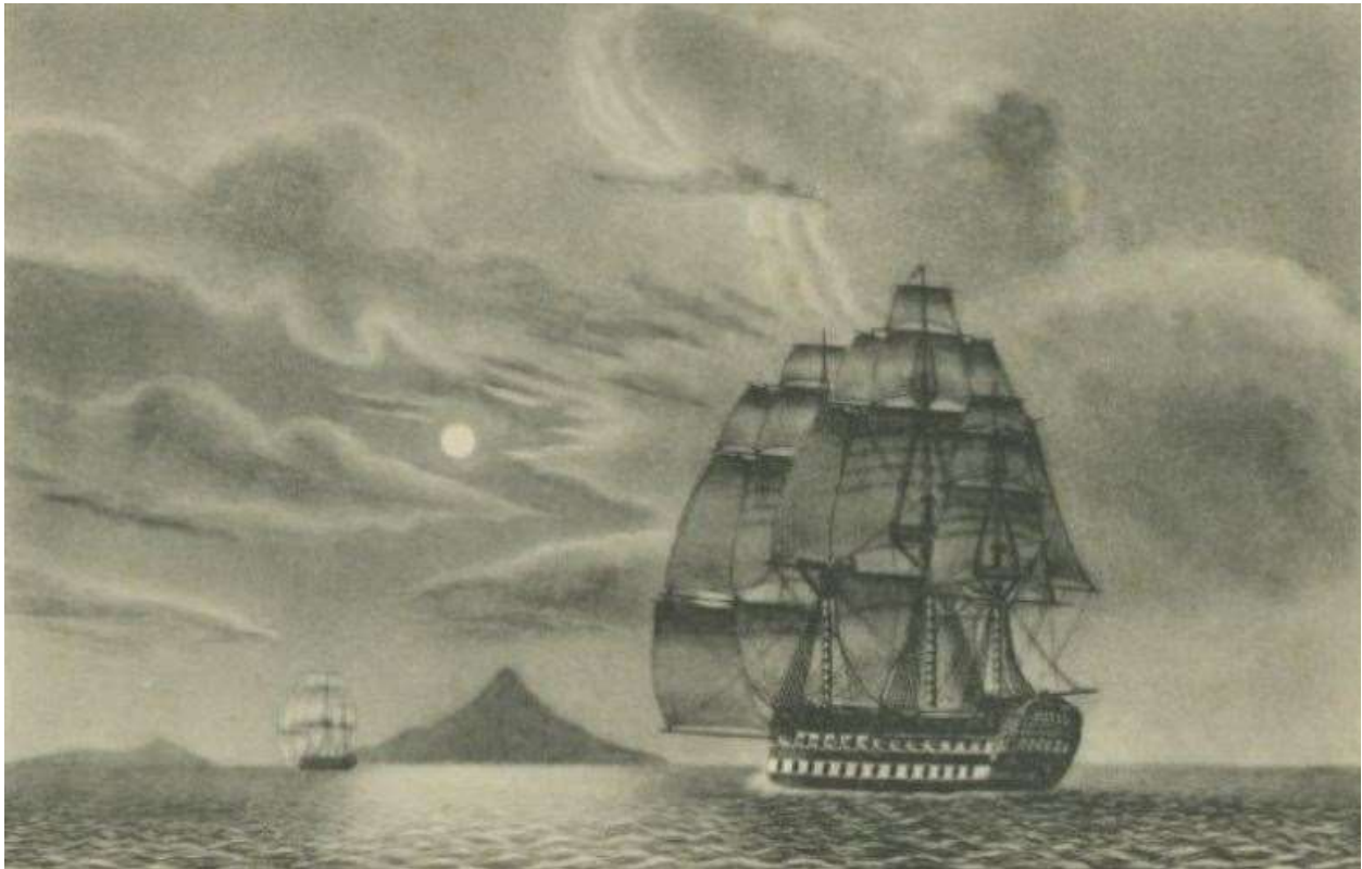
De "Admiraal Evertsen" was een linie schip gebouwd in 1808