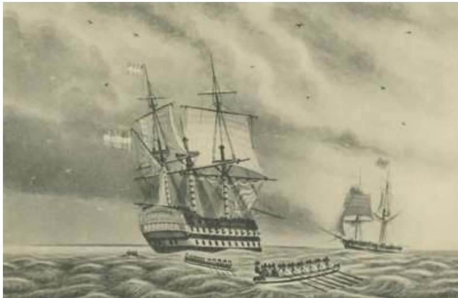
Fregat schip Zr.Ms Admiraal Evertsen en schoener Pickering tijdens redding op Diego Garcia