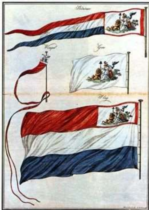
De vlag van de Bataafsche Republiek