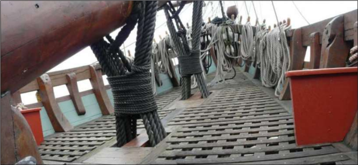
Woelingen aan de boegspriet ( Een woeling is een bindsel van touw om een rondhout geslagen om het vast te zetten, zie foto.)

21 mei, De voorstengen werden aangezet, en de woeling der boegspriet verlegd. De kuipers en zeilmakers van de Evertsen werden naar de Iris gestuurd om assistentie te verlenen met de herstelwerkzaamheden. Tijdens Achtermiddag wacht arriveerde Zr.Ms. Admiraal de Ruijter, het vijfde schip van het eskader.