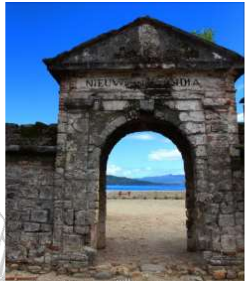
Figuur 7.1.2a en b; Strand ingang van het Fort Zeelandia van buiten gezien (a) en vanuit binnen (b) naar buiten kijkende