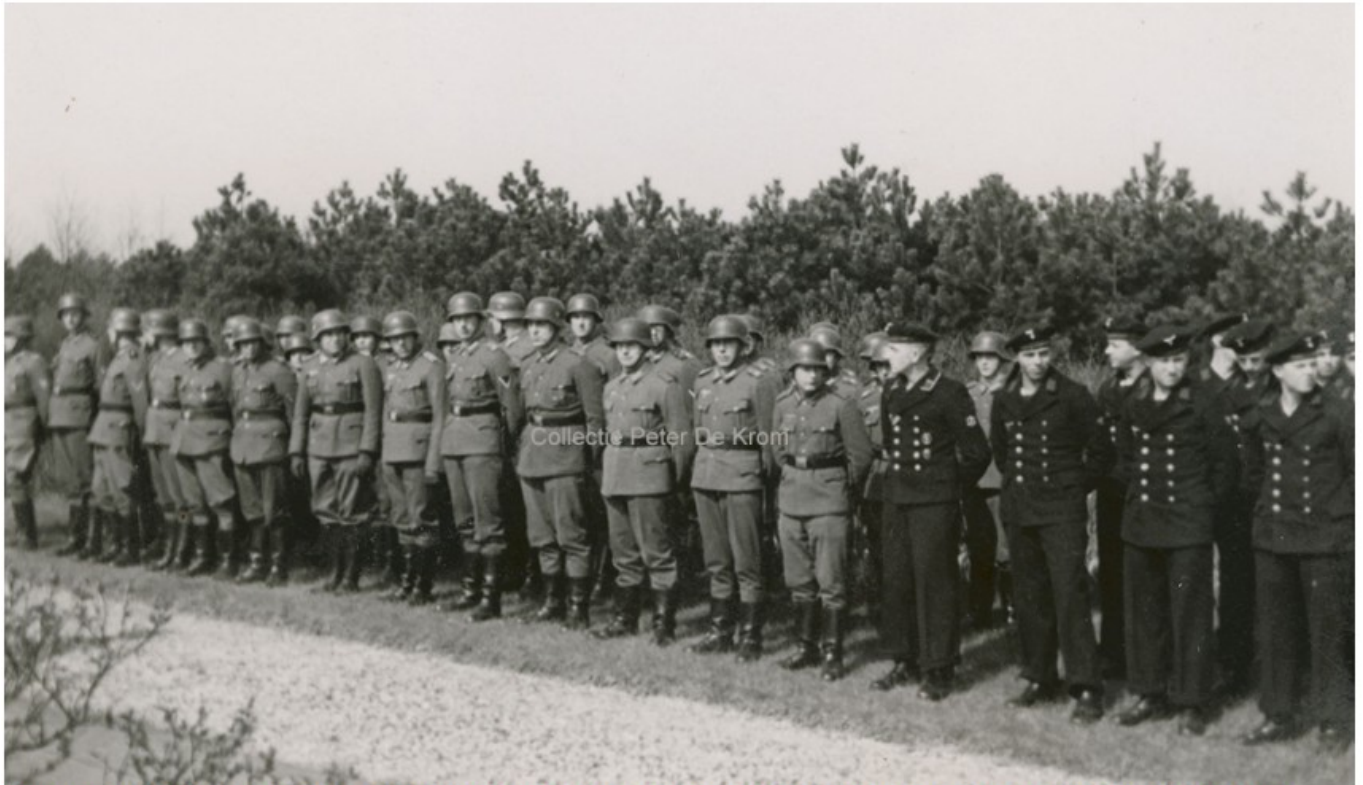
De militairen van de diverse onderdelen staan drie rijen dik opgesteld.