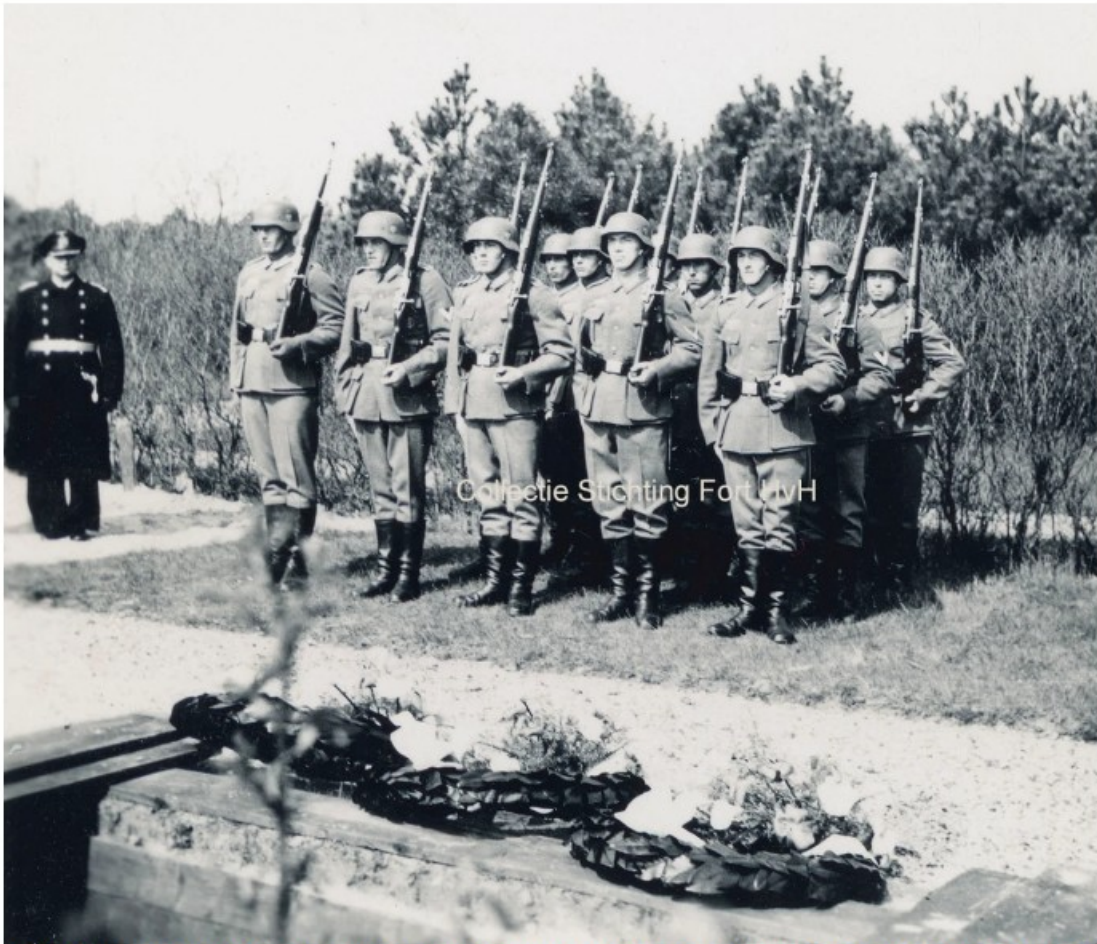
Het vuurpeloton maakt zich klaar om een salvo saluutschoten te geven.