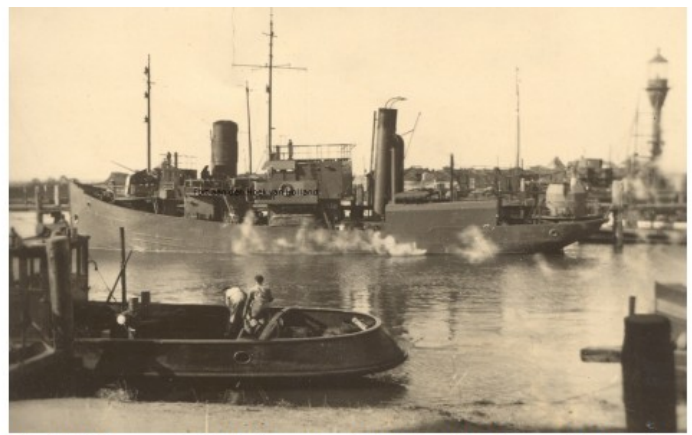
De HH08 van het Hafenschutzflottille Hoek van Holland in de Berghaven. Rechts de mast van het lichtschip Maas.

Drie vliegtuigen werden geraakt: één stortte neer in de monding van de Nieuwe Waterweg, de andere twee stortten iets zuidelijker neer op de Maasvlakte (toen nog zee). Het was één vliegtuig gelukt om bommen af te werpen waarbij één van de schepen licht beschadigd raakte, maar dat kon op eigen kracht verder varen. Het vierde vliegtuig, TR-H, draaide weg naar het noorden maar werd door het Flakgeschut van de M.A.A. 205 in brand geschoten, waardoor het gedwongen was een noodlanding op zee te maken. De H811 meldde twee vliegtuigen geraakt te hebben, de Voorpostenboten meldden gezamenlijk een vliegtuig te hebben getroffen. Vanaf de crashlocaties stegen dikke rookpluimen op.