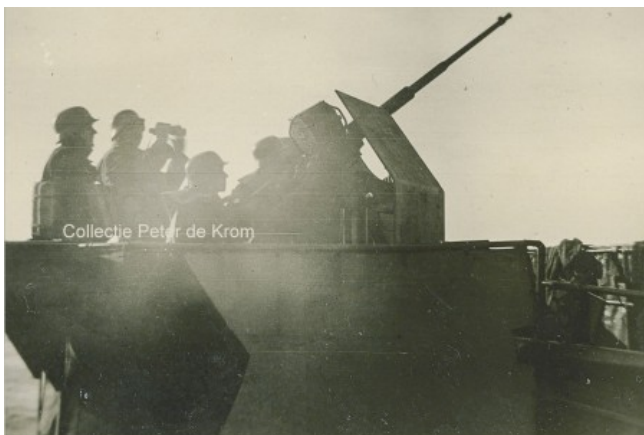
Een FLAKkanon op één van de schepen van het 8e Vorpostenflottille.

Om 18 minuten over 10 Engelse tijd was een formatie van vier Blenheims van 59 Squadron Coastal Command, onder leiding van Flying Lieutenant Anthony Fry, opgestegen van vliegveld Bircham Newton in Norfolk, nadat er eerder op de ochtend een melding bij het Squadron binnen was gekomen dat er een Westgeleit bij Den Helder was gespot. De Blenheims hadden de herkenningstekens TR-A, TR-E, TR-F en TR-H. Ze werden begeleid door drie Blenheims van 235 Sqn. Om 12.20u Nederlandse tijd zagen ze het konvooi de Nieuwe Waterweg op varen. De vier Blenheims van 59 Sqn. zetten vanaf 20-30 meter hoogte de aanval in, de anderen bleven net onder het wolkendek vliegen. Er werd op ze geschoten vanaf de begeleidende Vorpostenboten 803, 807 en 2005, door de H811 van het Hafenschutzflottille, en het lichte Flakgeschut van de Marine Artillerie Abteilung (M.A.A.) 205 dat in het Voorduin stond.