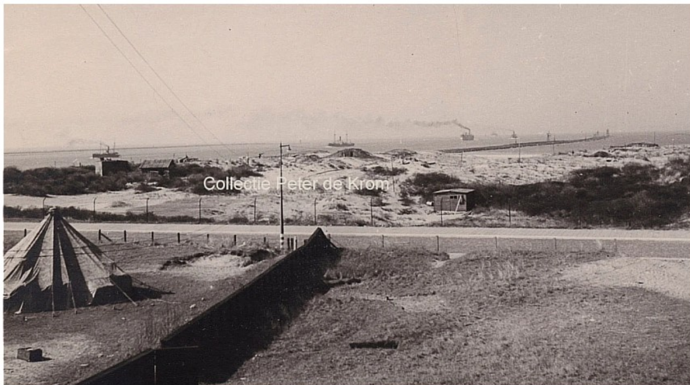
Een Westgeleit komt de Waterweg opvaren. Foto genomen vanuit het gebouw van L. Smit en Co aan de Strandweg door een soldaat van het 115e Reserve Flak Regiment, dat tot augustus 1941 langs de Waterweg stond opgesteld.

Door de vliegtuigen van Coastal Command werden ook Duitse Geleite , scheepskonvoeien, aangevallen. In deze konvoeien werd enerzijds ijzererts vanuit Zweden en Noorwegen aangevoerd, dat via de Rotterdamse havens naar het Ruhrgebied werd getransporteerd om verwerkt te worden voor de oorlogsindustrie. Dit waren de zogenoemde Westgeleite .