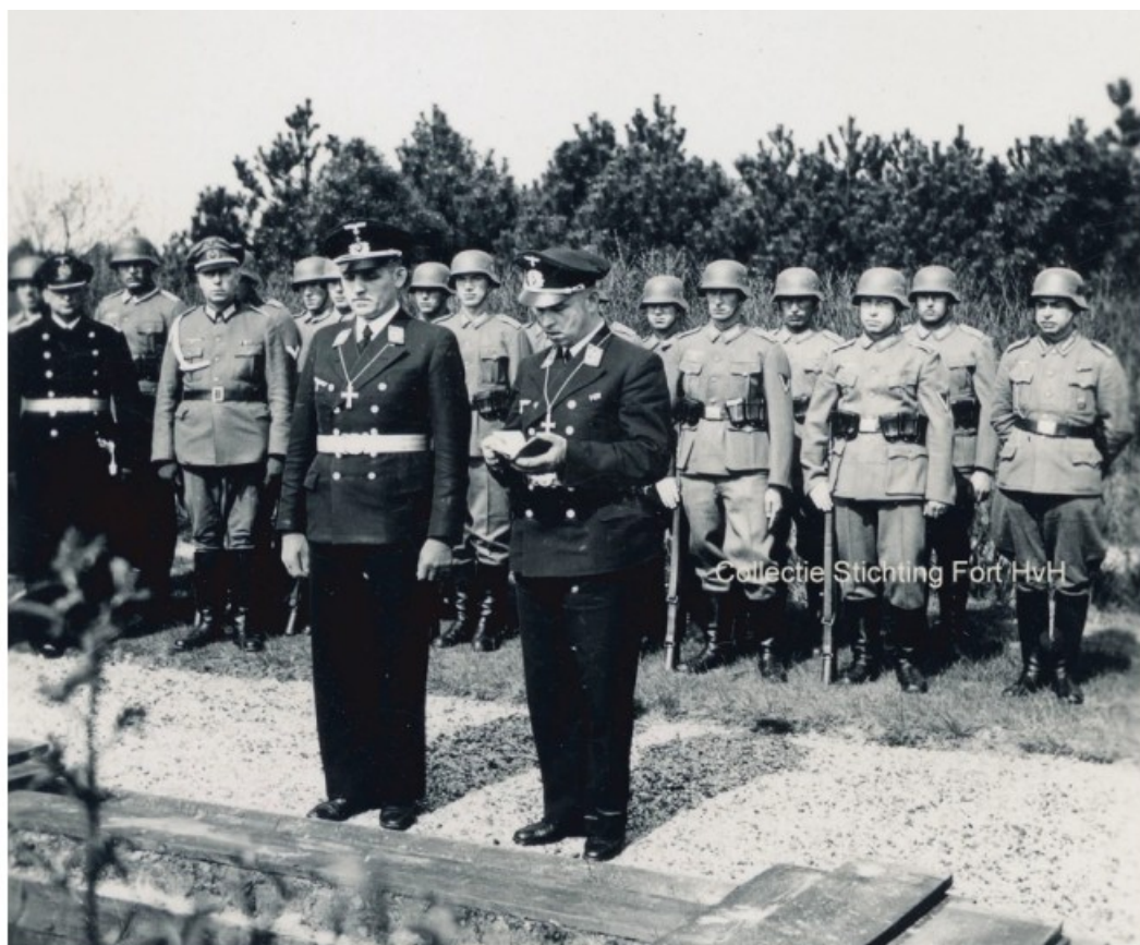
De predikers spreken een gebed uit.