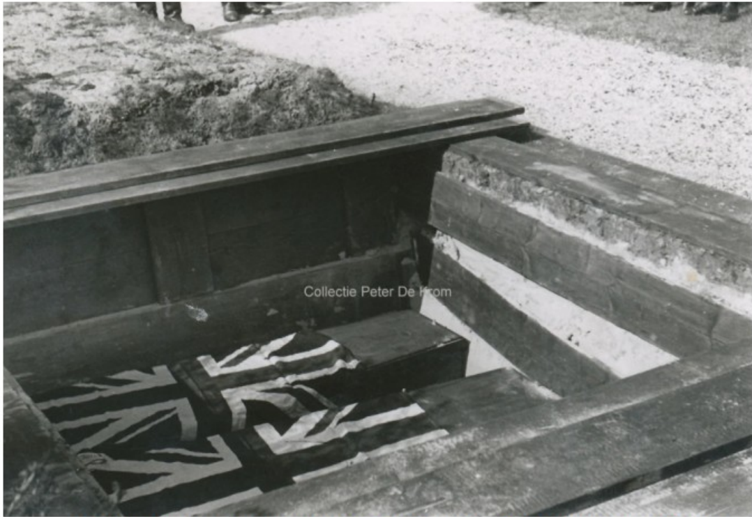
De kisten waren bedekt met de Engelse vlag.