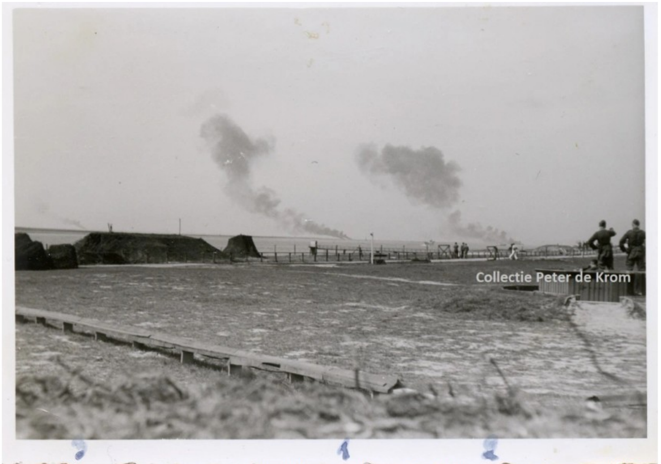
Drie rookkolommen geven aan waar de Blenheims neerstortten. De foto is genomen door een soldaat van het 115e Reserve Flakregiment dat aan de Emmaboulevard stond opgesteld. Met nummertjes gaf hij de volgorde van de crashes aan.

In de Berghaven waren schepen van de Zeerreddingdienst (Z.R.D.) gestationeerd. De bezetter had de reddingcapaciteit langs de Nederlandse kust in de eerste oorlogsmaanden flink uitgebreid in verband met de geplande (maar nooit uitgevoerde) aanval op Engeland, Operatie Seelöwe.