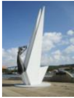
Midden en rechts: