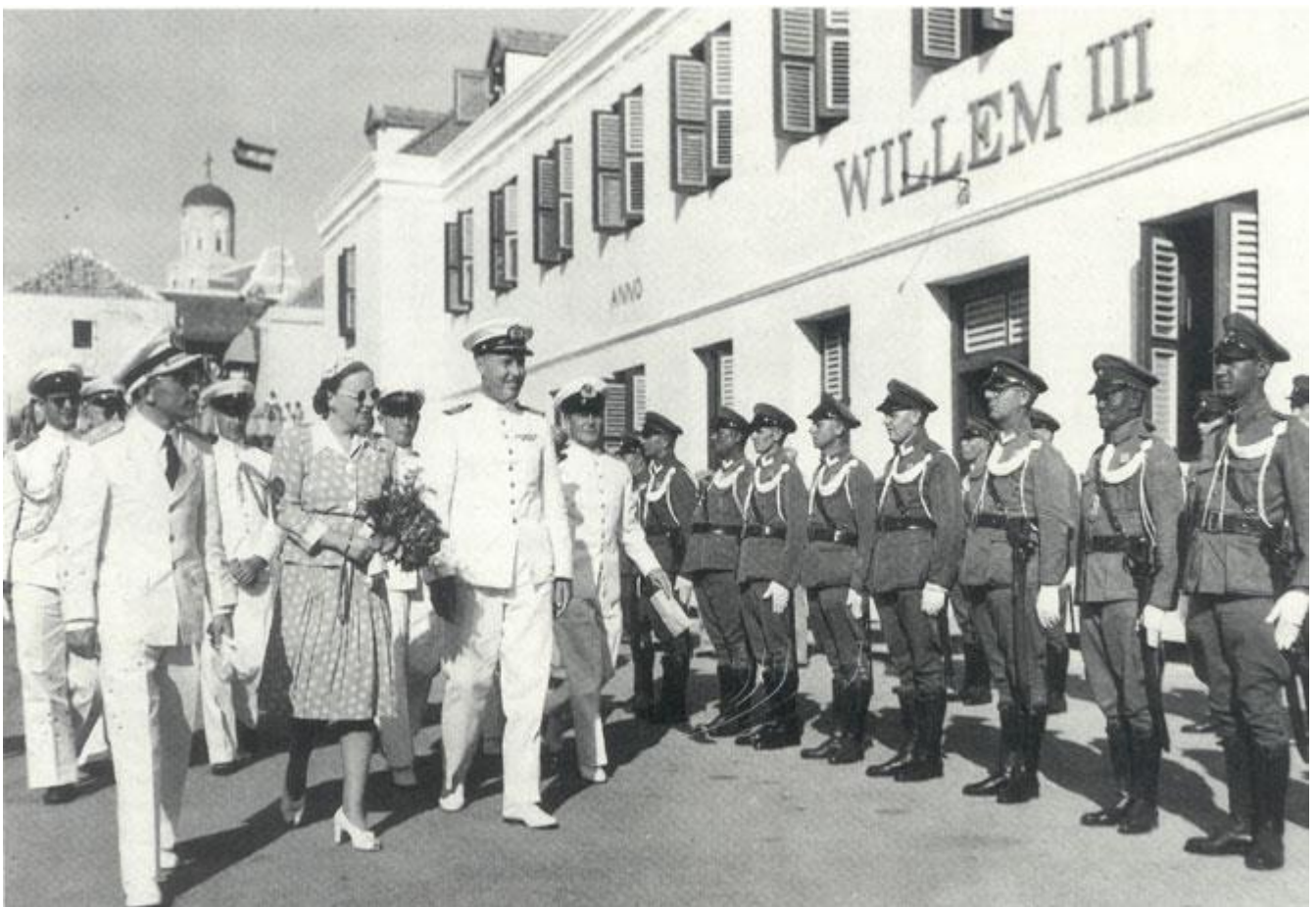
Prinses Juliana bezocht in 1942 de Nederlandse Antillen. Hier inspecteert zij militairen die hielpen bij de verdediging van Curaçao