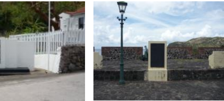
Oorlogsmonument St. Eustatius