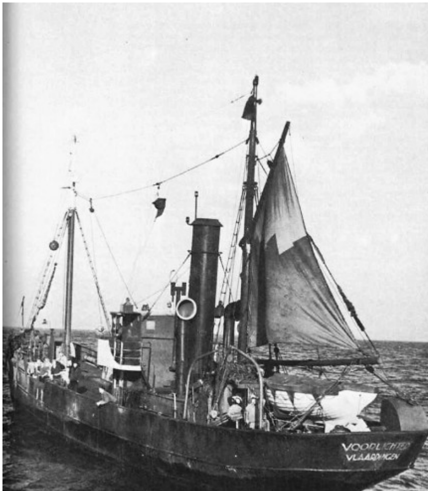
De VL 114 "Voorlichter"