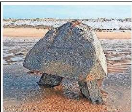
Een tetraëder die boven water kwam tussen Castricum en Egmond.