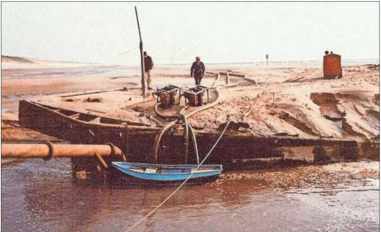
Tijdens de laatste bergingspoging in 1980.

Iets verderop richting Egmond kwamen zogenoemde tetraëders boven water. Ook al van Duitse makelij, maar dan van een halve eeuw later. Deze betonnen versperringen waren bedoeld om een geallieerde invasie te stoppen.