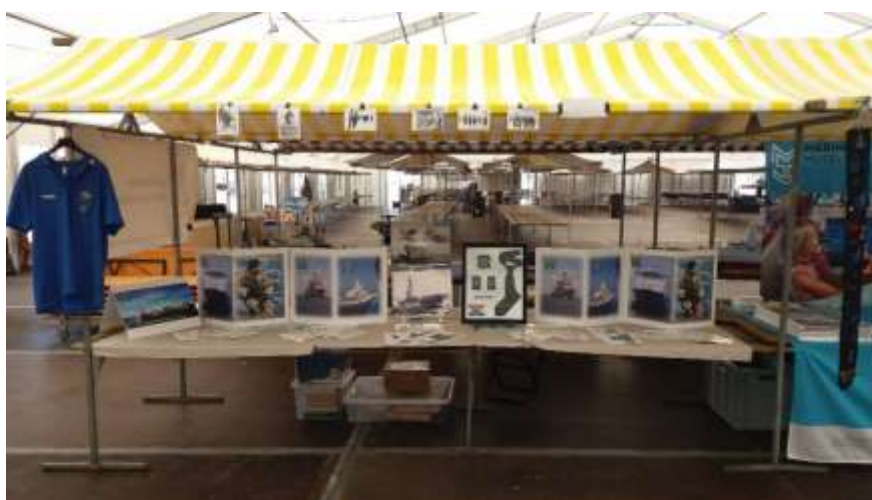
Reünie landgoed Bronbeek 2019