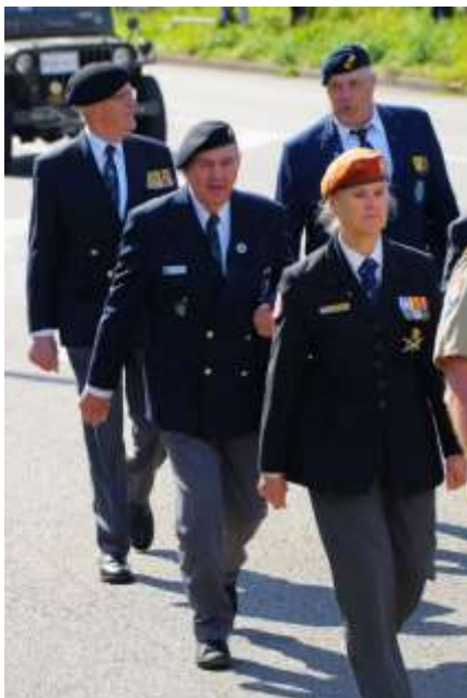
Defilé Wageningen 2019

Enige indrukken van festiviteiten bij de PAM;