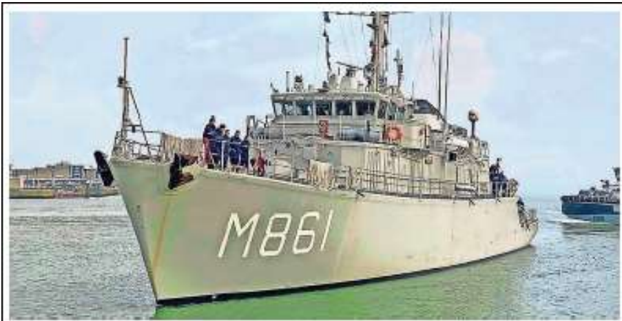
De Zr.Ms. Urk blijft uit bezuiniging aan de kade.

beschuldigd van freeriden, als klaploper meedoen zonder de overeengekomen bijdrage te leveren.