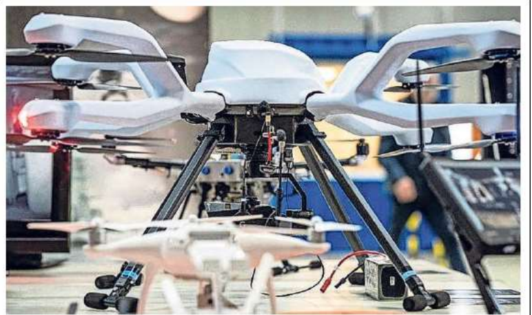
Er zit veel beweging in de drone-markt. Modellen verouderen snel.

Zoute lucht Dat bleek eerder deze eeuw tijdens de invoering van de NH90 helikopters op vliegveld De Kooy die mankementen kregen vanwege de inwerking van zoute lucht en vocht. Hetzelfde speelt bij drones die door slecht weer over de golven scheren en daarna op een stampend en schommelend scheepsdek moeten zien te landen. Al sinds de start is het Maritime Drone Initiative gevestigd op Den Helder Airport. Een logische keuze gezien de historie van vliegveld De Kooy als plek voor de maritieme luchtvaart. Het ziet er naar uit dat hun accommodatie nog verder verbeterd wordt. Binnen de uitbreidingsplannen aan de zuidkant van het vliegveld is volgens luchthavendirecteur Conny van den Hoff ruimte voor dronesbedrijven en -opleidingsinstituten. Daarnaast is er sprake van dat op Willemsoord, in de leeggekomen hal naast de bioscoop, een vlietschool voor drones komt.