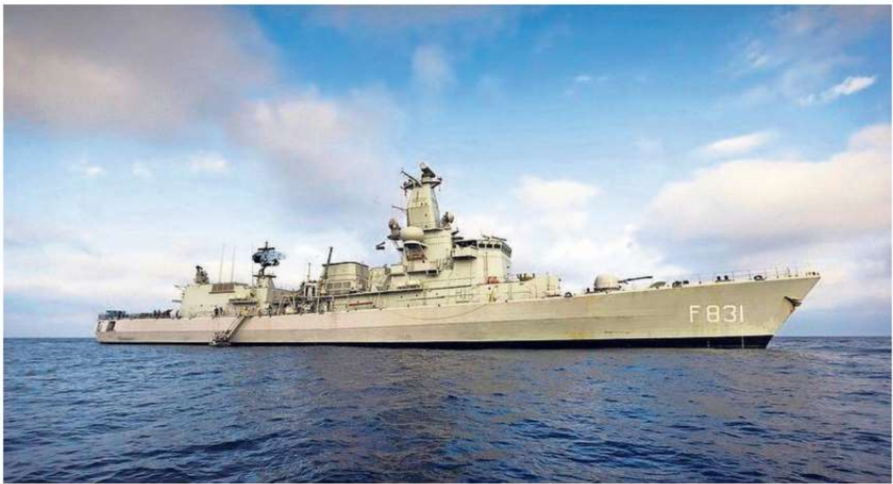
Zr.Ms. Van Amstel is straks het enige M-fregat nog in de vaart.