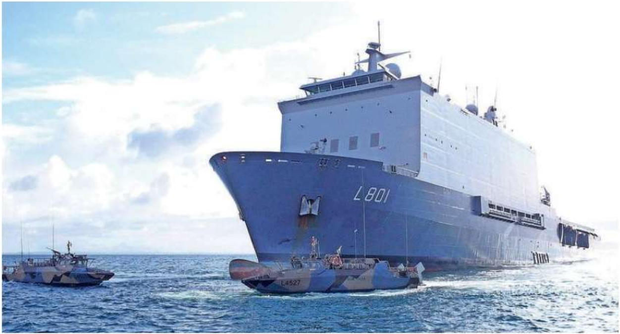
De Zr.MS. Johan de Witt.