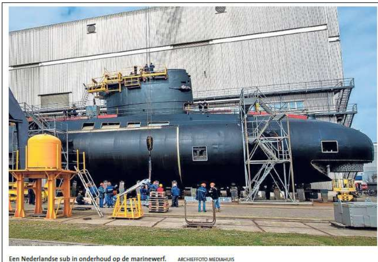
Een Nederlandse sub in onderhoud op de marinewerf.

eigendommen moeten worden beschermd. Voor het onderhoud van schepen van de KM en de rijksrederij is ruimte op het terrein van het Marinebedrijf”, aldus Visser. tkMS gaat inmiddels samenwerkingsverbanden met Nederlandse maritieme bedrijven aan. Zo werkt de Duitse werf onder meer samen met Heinen & Hopman, Van Halteren, Nedinsco en Thales. Dit voorjaar sleepte de werf een grote order binnen voor de Noorse en Duitse marine.