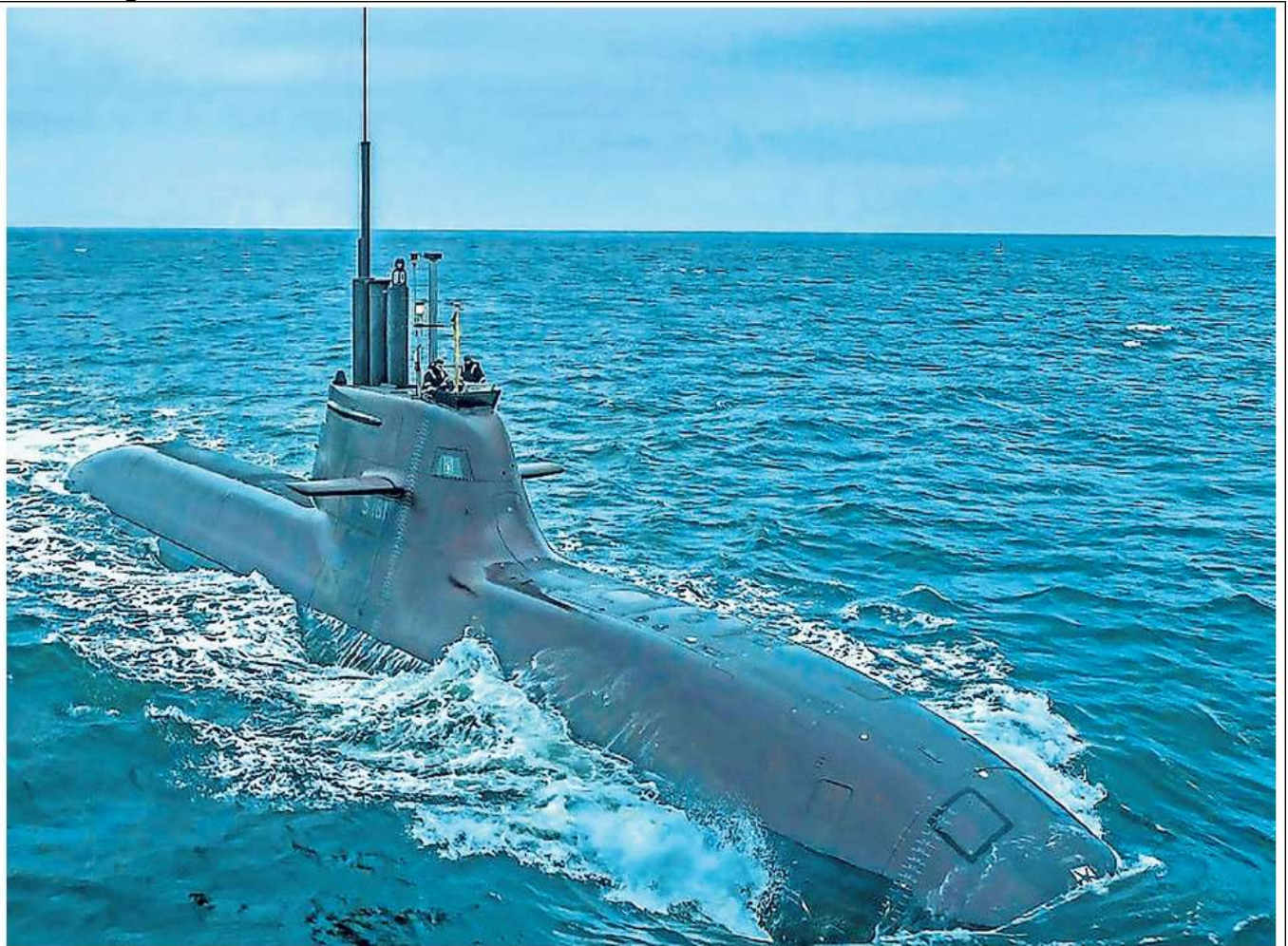
Het Duitse ontwerp wordt aangepast aan Nederlandse eisen.