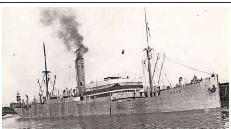
Stoomschip Ruth is nu een wrak vlakbij Den Helder.

en ging meteen ten onder. In het stuurhuis van de Lummetje is een papieren zeekaart met nummer 1801.10 uit de 1800-serie aangetroffen. Deze kaarten worden samengesteld door de Dienst der Hydrografie van de marine. Volgens een intern onderzoek van de Koninklijke Marine blijken meerdere factoren een rol te hebben gespeeld bij de verkeerde markering. Het wrak van de Ruth werd in 2008 voor het laatst onderzocht. Er was een klein verschil met de positie zoals die op dat moment in de kaart stond, maar geen reden voor een Bericht aan Zeevarenden. In de huidige zeekaarten had de juiste positie van de Ruth wel opgenomen moeten zijn. 'Dit is niet gebeurd omdat de meest recente gegevens niet op de goede plek in het systeem van de Hydrografische Dienst waren opgenomen', staat in het rapport.