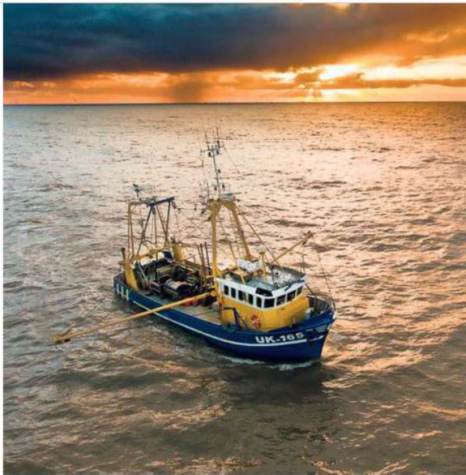
De Lummetje op zee.