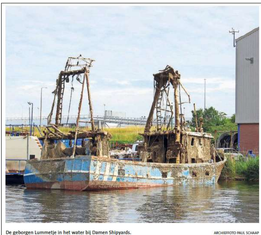
De geborgen Lummetje in het water bij Damen Shipyards.

Den Helder □ Voor de Koninklijke Marine was het zinken van de Lummetje aanleiding om zeekaarten opnieuw tegen het licht te houden. Natuurlijk is de positie van het in de oorlog gezonken vrachtschip Ruth aangepast, maar ook is gekeken naar andere zeekaarten. Daarna zijn bepaalde wijzigingen doorgevoerd. 'De Dienst der Hydrografie heeft een aantal van dit soort afwijkingen geïdentificeerd en in de kaarten gecorrigeerd', meldt de Onderzoeksraad in het rapport 'Kapseizen en zinken viskotters'. Het ruim honderd meter lange wrak van de Ruth ligt direct ten westen van de Razende Bol.