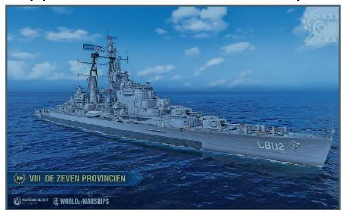
De Zeven Provinciën.

Er zijn nogal wat fouten gemaakt met scheepstypen en -namen, maar toch kijken de spelers van het computerspel World of Warships met positieve verwachtingen uit naar de toevoeging van een Nederlandse marinevloot aan deze internationale game.