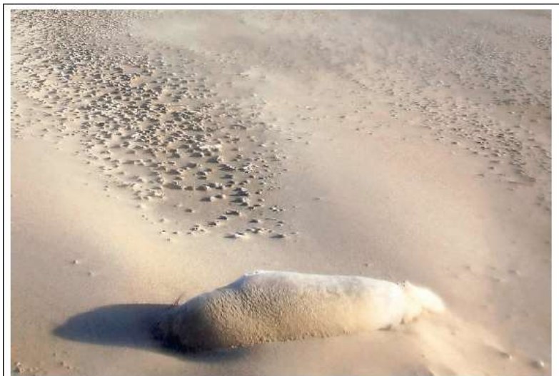
Een hoopje zand bleek bij nader inzien een levend zeehondje.

Anders was ik er niet naartoe gelopen, want ik wilde de pup en zijn moeder die eventueel in de buurt was niet storen. Maar toen bewoog hij een klein beetje.” Dijkxen belde de zeehondenopvang en zag nog tijdens het bellen dat de pup steeds levendiger werd, maar ook dat een van de ogen ontstoken was.