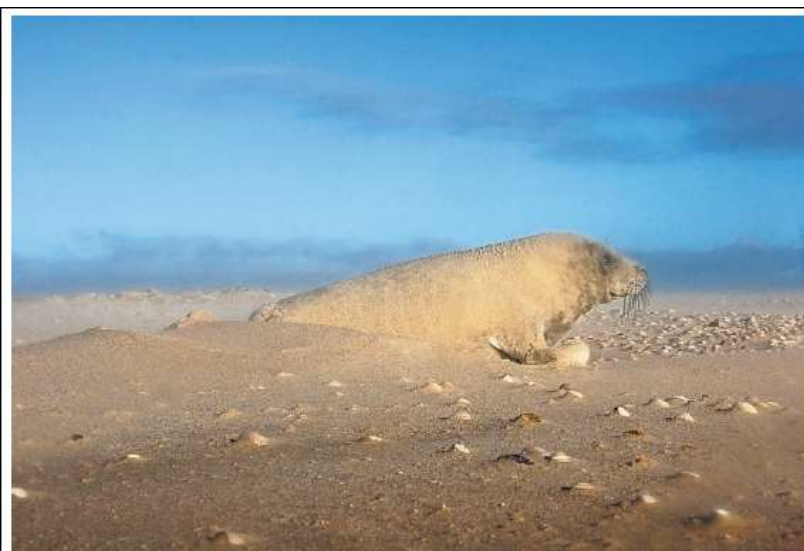
De diervverzorgers konden niet bij het hulpbehoevende zeehondje komen.

Bij een wandeling langs de zuidpunt van De Hors stuitte natuurfotografe Sytske Dijkzen zondag op een hoopje zand dat bij nader inzien een jong grijs zeehondje bleek te zijn, nog met de witte geboortevacht. „Hij was ondergestoven en ik dacht dat hij dood was.