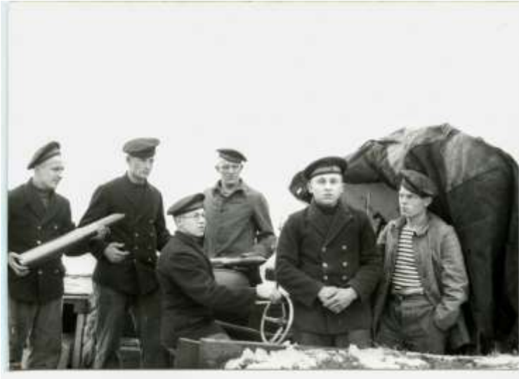
Geschuts bemanning tbv Fort Pannerden