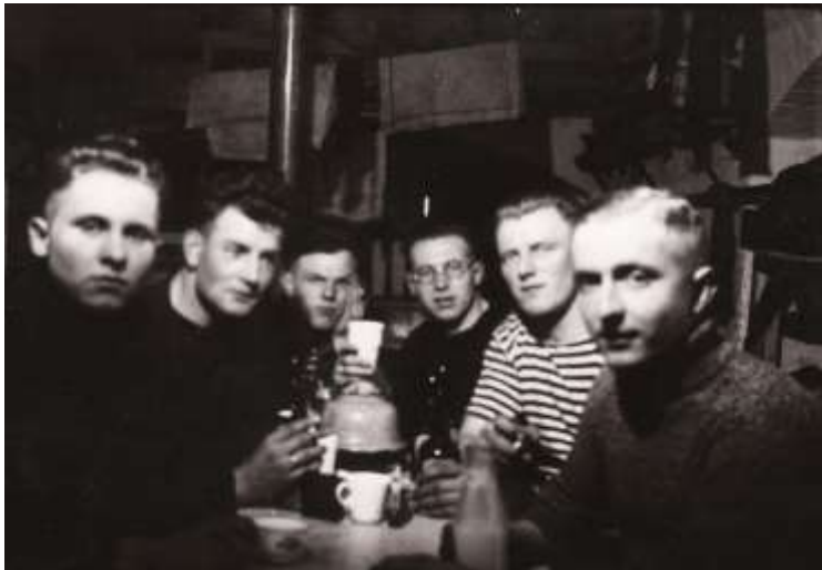
Stuksbemanning van de twee 7.5 cm kanons