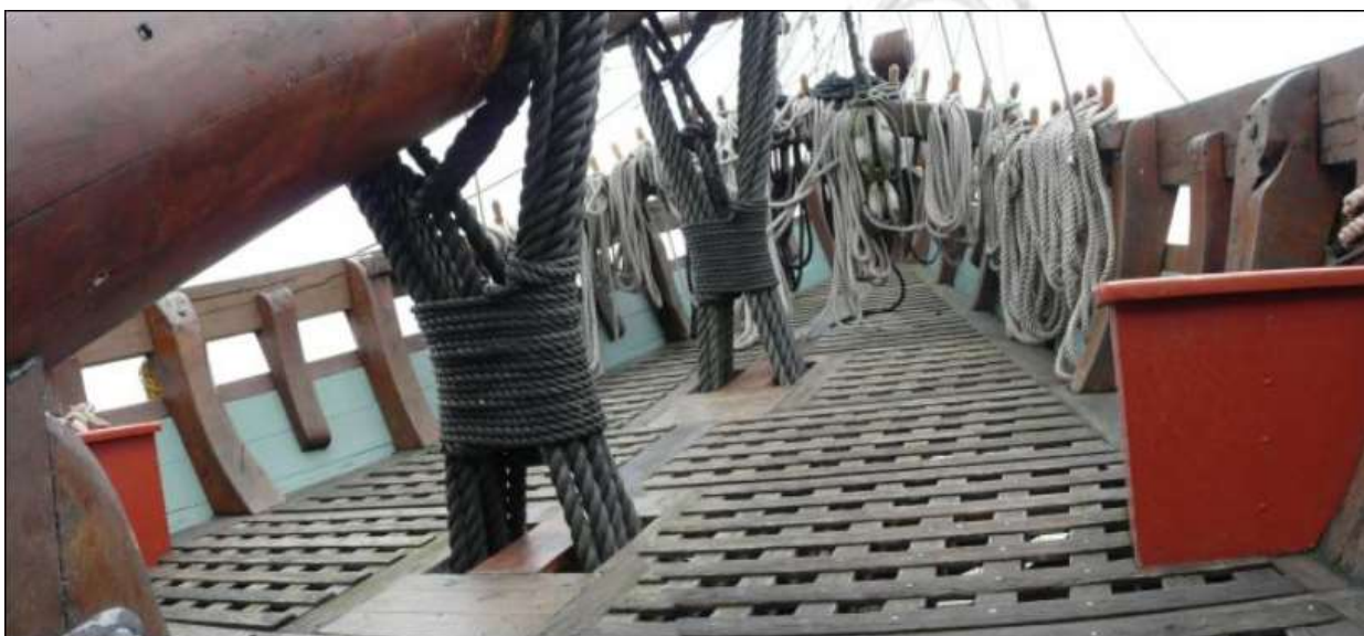
Woelingen aan de boegspriet ( Een woeling is een bindsel van touw om een rondhout geslagen om het vast te zetten, zie foto.)

20 mei, Ontvingen van de Iris 9 vaatjes duiten en 4 kisten zilvergeld. Dit geld was bestemd voor de betaling van de bemanning en de aanschaf van voorraden. Vanwege de vertraging van de machtsovergave ging dit echter snel op en moest er geld worden geleend. (Kroniek van Nederlandsch Indië, 1816). Wij zonden 260# rijst en 70 flessen Arak naar de Iris