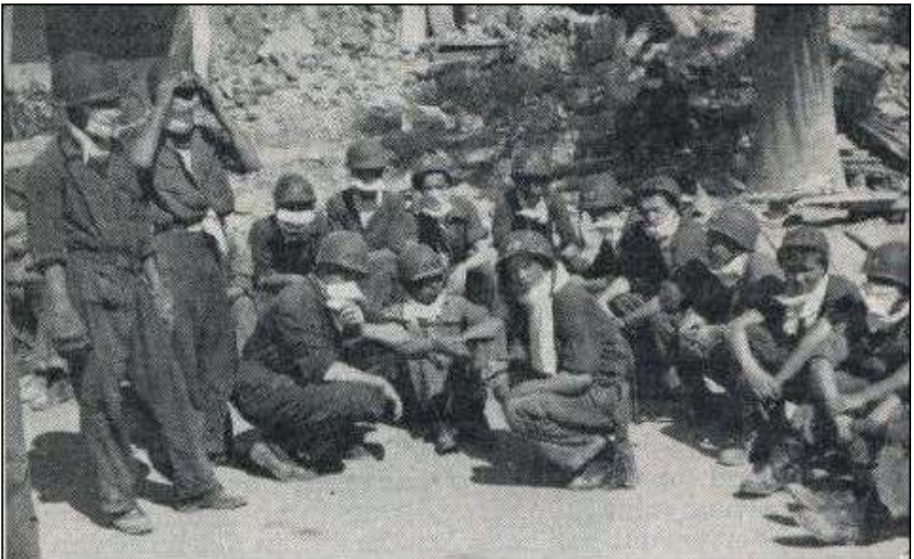
Tussen alle ellende een ogenblik rust

Iedereen heeft haast, bureaux zijn verlaten, arrestanten worden ontslagen, schrijvers sleuren aan sloepstakels, officieren hebben het druk met orders geven en na enige tijd komt er tekening in deze schijnbare verwarring en liggen de sloepen langs de wal, de reddingploegen klauteren langs het stalen net erin en even later convergeren de sloepen van alle Nederlandse schepen naar de haveningang. Merkwaardig is toch die Hollandse jannen. Zelfs de grootste lastposten blaken nu van activiteit, over schaften en aflossen wordt niet meer gesproken, lui die anders de boot afhouden staan te dringen om mee te gaan en niets is hen te veel.