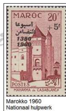
Marokko 1960 Nationaal hulpwerk

Bij het ter perse gaan van de maart editie kreeg de redactie nog een pracht stuk binnen over een hele ingrijpende gebeurtenis in Marokko.