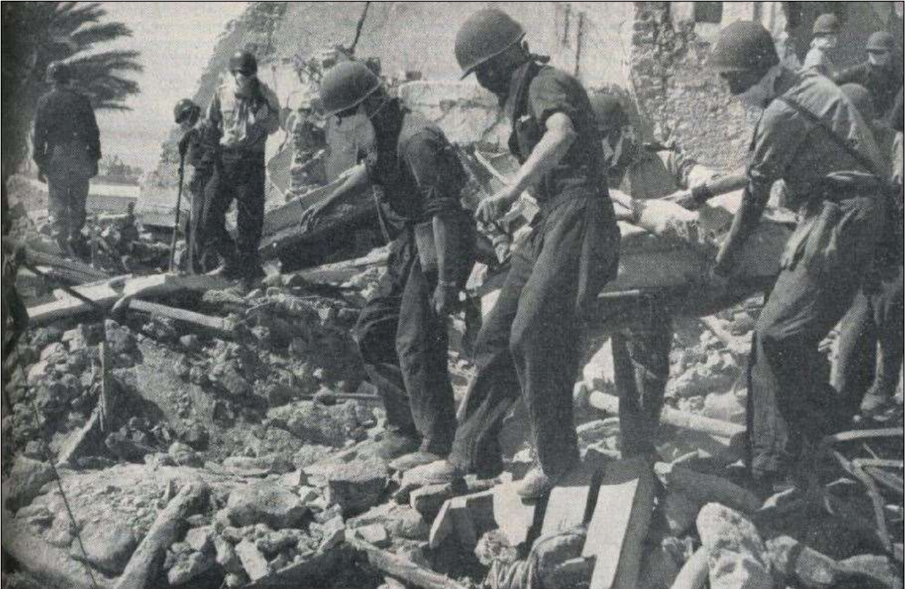
Een gewonde heeft men uit de puinhopen weten te bevrijden...

De wijk waar gisteren nog onze ploegen werkten is nu hermetisch afgezet. In de Europese woonwijken is men bezig om de ruïnes van de beide heerlijk gehavende hotels (Sahara en Mauretania) te onderzoeken. De aard van de verwoesting is hier anders. Van ineenstorting zoals in de casbah is hier geen sprake. Veel gebouwen van gewapend beton staan nog overeind, hoewel ze volledig zijn ontworcht en onbewoonbaar zijn verklaard. De inwoners hebben hier echter de kans gehad om eruit te komen. Een gedeelte echter der betonnen gebouwen is in elkander gedrukt alsof er een enorme wals over heen is gegaan, zodat welhaast niemand er levend uit is gekomen. Men is bezig met pneumatische hamers stukken uit de neergestorte verdiepingsvloeren te hakken, die daarna door grote kranen worden weggesleurd, zodat men kan zien wat er onder zit. Verschillende auto's zie ik, waaronder een volkswagen, die zijn platgedrukt als een dubbeltje. Nog niet één gebouw in de stad Agadir is veilig verklaard om te bewonen en het begint er naar uit te zien, dat de stad ten dode is opgeschreven. Alle nog overeind staande gebouwen wil men nu met dynamiet laten springen om te voorkomen dat zij een gevaar blijven opleveren voor hen die er zich in zouden wagen.