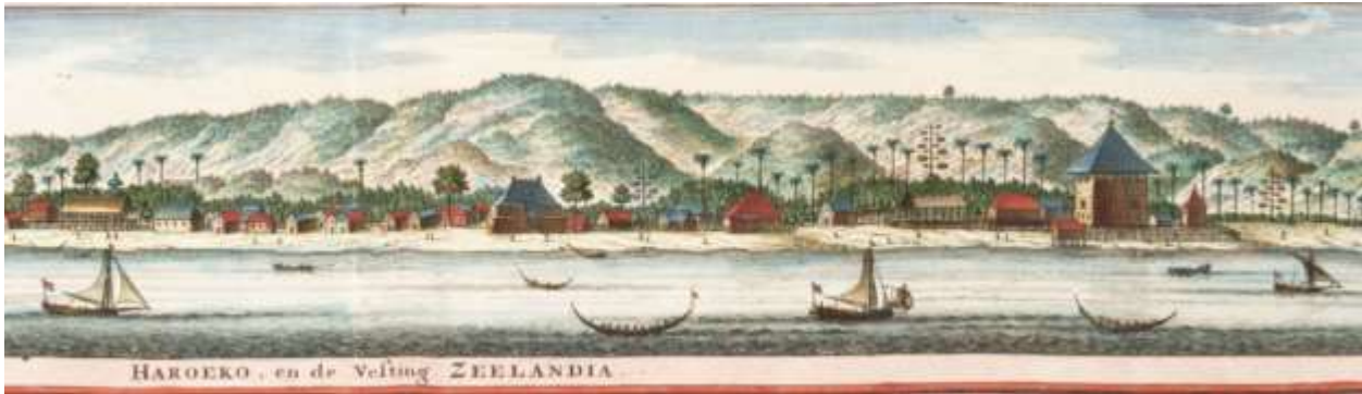
Figuur 7.1.1 Gezicht op het dorpje Haroko in de 17 e eeuw. Het fort ligt rechts en het residentie huis in het midden. Het hoofdgebouw van het fort was al geheel vervallen in Veerman's tijd en volgens beschrijving stonden er alleen de muren er nog.

*) Veerman verteld niet hoe zij dit dreigement ontvingen, maar dat zal wel via een lokale geruchten zijn geweest.