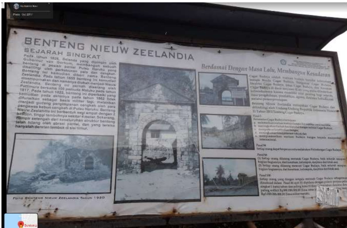
Figuur 7.1.2 c en d; Uitlegbord voor de ingang (c), (zie vertaling aan het eind van het hoofdstuk) en d) Oud verroest kanon voor de zee wal, waarschijnlijk daterend uit de VOC tijd