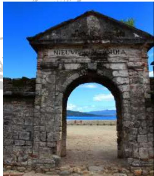
Figuur 7.1.2a en b; Strand ingang van het Fort Zeelandia van buiten gezien (a) en vanuit binnen (b) naar buiten kijkende