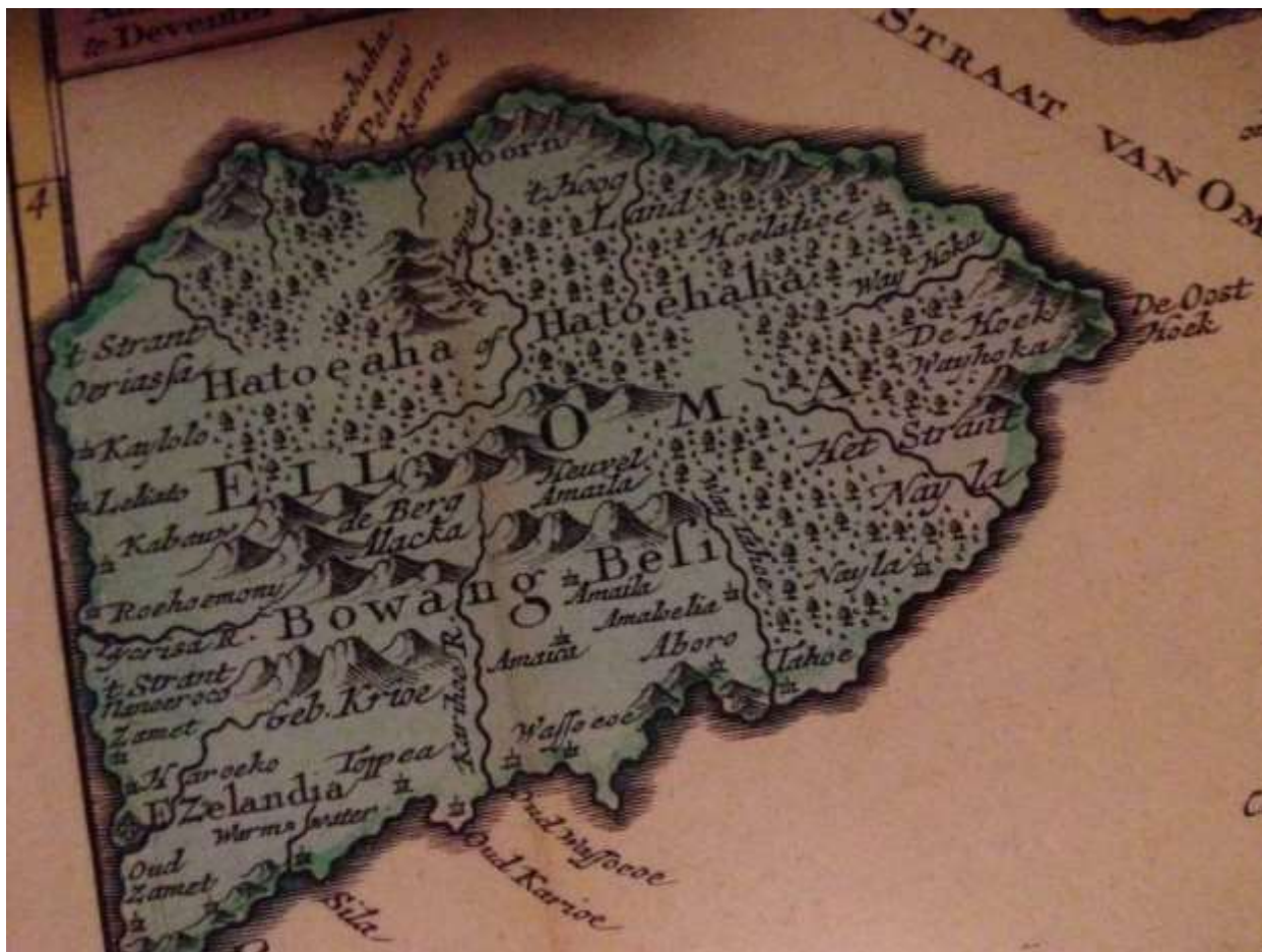
Figuur 7.1.3 Oude kaart van Haruko, ook wel Hatoeha genoemd

De inwoners der negorij Oma hadden pardon doen vragen voor de beganen rebellien, Den oud Radja van Aboro welke bij ons was , bood zig aan om het volk van Oma herwaards te lokken en hun vrede te beloven mits zig onderwerpenden aan ons. Hij vertrok omtrent den middag derwaarts op een palenkeijn of draagstoel met agt man van hier, met zig meede nemende een klein hollandsch vlagjen en twee flessen arak.