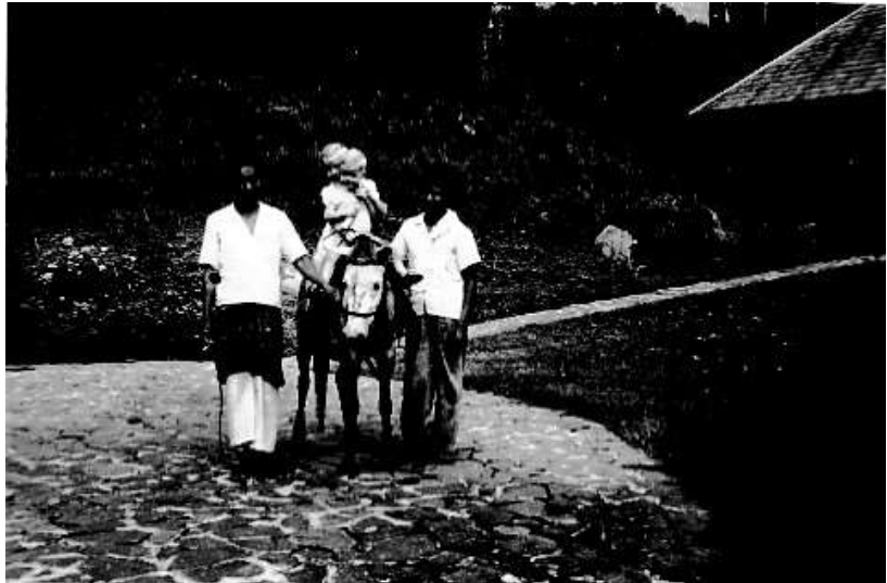
Deze foto is niet van het gezin Sterkenburg maar van onze redacteur in 1947 om een illustratie te geven hoe we daar Pony reden....

In februari 1941 tijdens een verlofweekend fotograferen de ouders elkaar met de kinderen. Voor de laatste keer is het gezin compleet. De dreiging van een Japanse invasie brengt met zich mee dat Sterkenburg voor langere tijd weg is. Uiteindelijk wordt Nederlands-Indië in maart 1942 bezet; enkele dagen eerder heeft Sterkenburg met een vliegtuig Ceylon weten te bereiken; hij kan niet meer naar huis terugkeren.