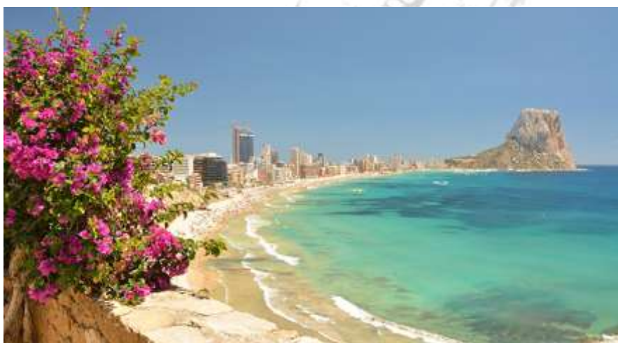
Calpe aan de Costa Blanca

De politie en de Guardia Civil handhaafde zeer streng, vele malen ben ik op weg naar de supermarkt aangehouden en moest ik aantonen in welk appartement ik verbleef.