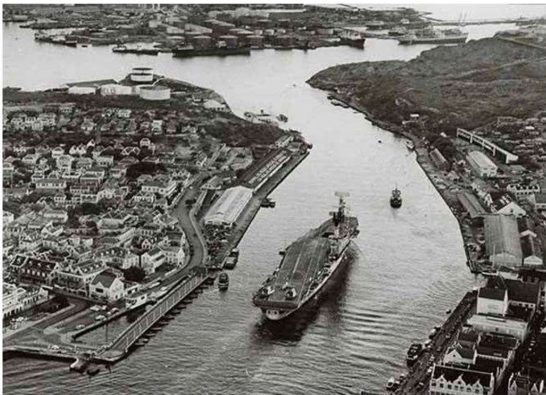
Het vliegkampschip Hr.Ms. Karel Doorman in de Sint Annabaai, 1948. Op de achtergrond de Shell-raffinaderij.

niet bekend. Misschien is er onder onze lezers meer bekend doordat zij deze trip hebben meegemaakt en herkennen jullie de foto. Stuur dan even een berichtje naar de redactie.