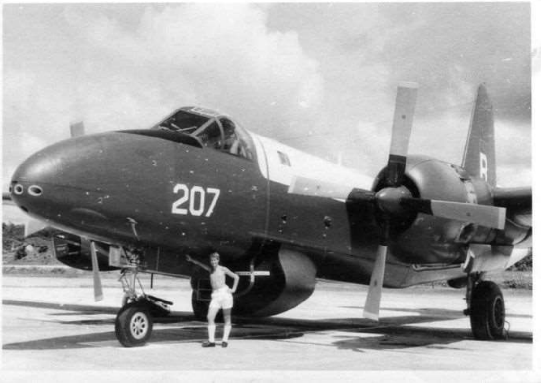
Een Neptune met kogelgaten van een beschieting in Nieuw-Guinea

geworden en wilde niet altijd meer weg zijn. Ik heb toen de Marine Luchtvaartdienst verlaten en gekozen voor een carrière in de burgermaatschappij.”