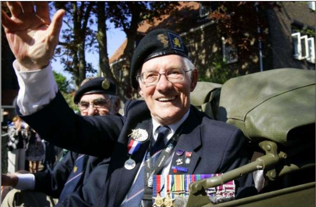
Een echte veteraan tijdens de derde editie van het Vrijheidsdefilé te Wageningen