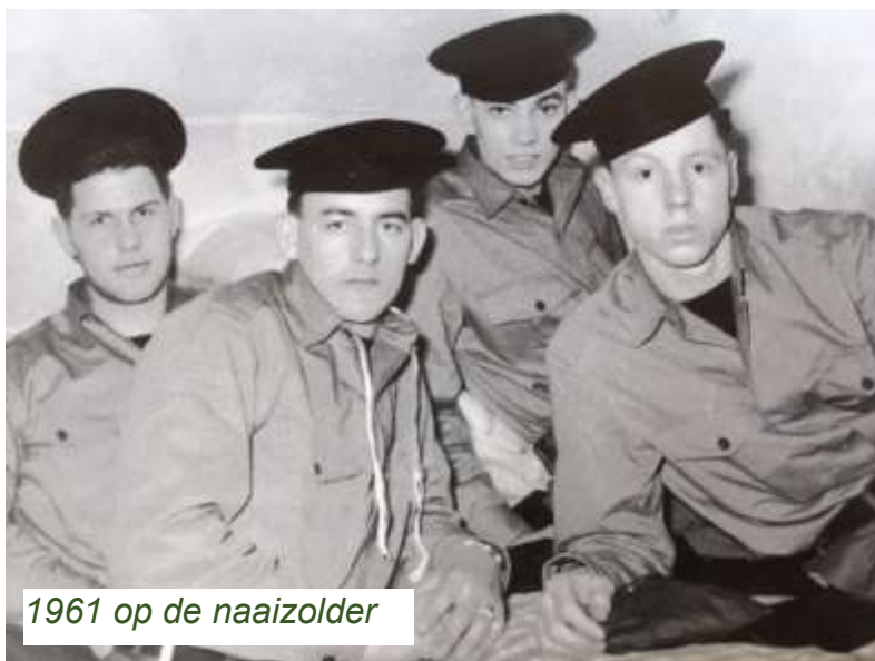
1961 op de naaizolder