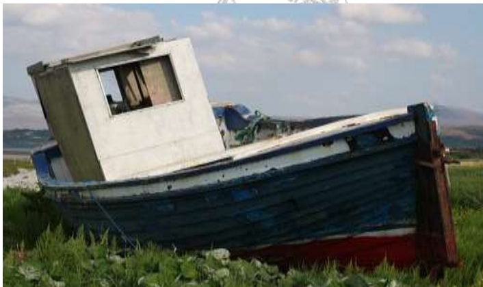
Diemen, 21 augustus 2020 Wim Degen

Die avond at Bart braaf thuis zijn heerlijke pannenkoeken; de aarde scheen tóch rond te zijn. Een zijn boot dan? Die liet Bart op het strand zetten. Als het goed is ligt zij er nóg!